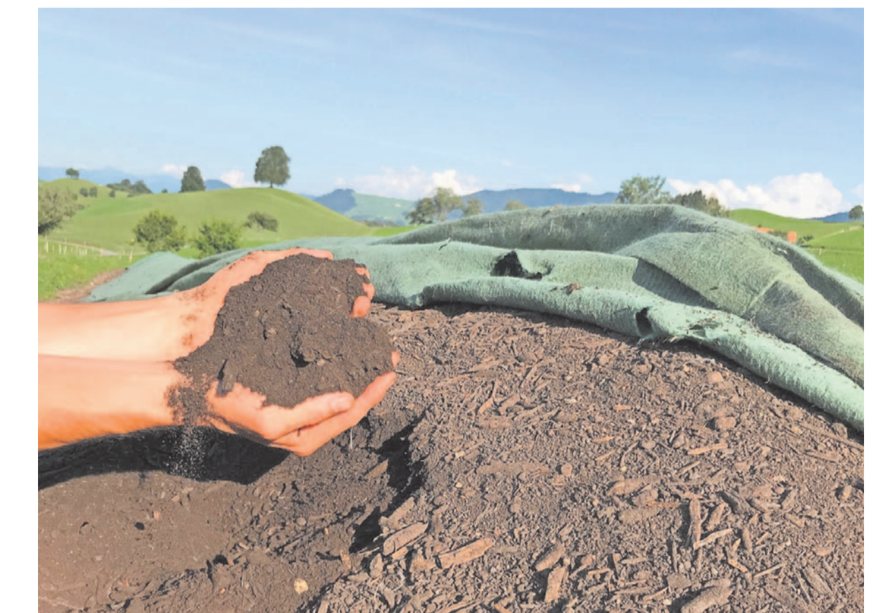
Ethik beginnt auch an ungewöhnlichen Orten.

Gemäss Linard Bardill steht hinter dem Leitmotiv «Heart of Change» die Suche nach neuen Wegen, um globalen Krisen zu begegnen. Erarbeitet und diskutiert werden Ansätze, um eine ethische Grundlage für das Leben auf diesem Planeten im Einklang mit Mitmenschen, Natur und Ressourcen zu schaf-